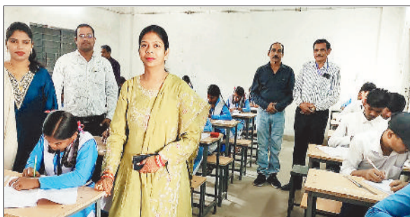
परीक्षा केंद्र का निरीक्षण करते माशिम सदस्य।