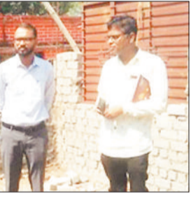
अधिकारियों को निर्देश देते सीईओ।