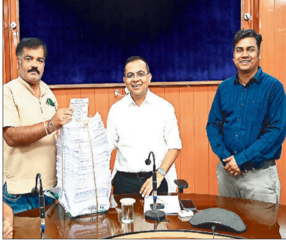
मतदाता सूची का प्रकाशन करते कलेक्टर, एडीशनल कलेक्टर व राजनीतिक दल के प्रतिनिधि

निर्वाचन आयोग के निर्देशानुसार चार महीने तक चले निर्वाचक नामावलिओं का विशेष गहन पुनरीक्षण (एसआईआर) के बाद मतदाता सूची का अंतिम प्रकाशन शनिवार 21 फरवरी को किया गया। जारी सूची के अनुसार जिले में कुल 7 लाख 80 हजार 236 मतदाता पंजीकृत हैं। बताया जाता है कि मतदाता सूची ड्राफ्ट प्रकाशन के बाद 7 हजार 11 मतदाताओं की शुद्ध वृद्धि हुई, जबकि पूर्व में आंकड़ों पर नजर डाली जाए तो जिले में कुल मतदाताओं की संख्या 8 लाख 45 हजार 577 थी जो कि 4 महीने तक चले गहन पुनरीक्षण कार्य के दौरान 7 लाख