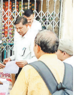
कार्यवाही करती निगम की टीम।

नगर निगम द्वारा सम्पत्तिकर, समेकित कर, जलकर आदि सहित विभिन्न करों की एक बड़ी बकाया राशि बकायादारों से प्राप्त की जानी है, इस हेतु निगम द्वारा बकायादारों को बार-बार नोटिस व वार्ड आदि जारी कर बकाया राशि का भुगतान निगम कोष में किए जाने हेतु कहा जा रहा है, किंतु बकायादारों द्वारा राशि जमा करने में रूचि नहीं दिखाई जा रही है, जिसके कारण एक ओर जहाँ निगम को आर्थिक क्षति उठानी पड़ रही है। राजस्व अमले द्वारा अब इन बकायादारों के विरुद्ध कार्यवाही शुरु कर दी गई है। इसी कड़ी में